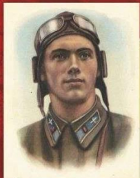
ГАСТЕЛЛО Николай Францевич (1907-1941)

Военный лётчик, капитан, командир эскадрильи. Погиб 26 июня 1941 года совершая огненный таран: направил горящую машину на механизированную колонну врага.