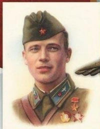
ТАЛАЛИХИН Виктор Васильевич (1918-1941)

Советский офицер, танковый ас. За два месяца 1941 г. уничтожил 52 танка противника, став самым результативным танкистом в Красной армии за всю историю Великой Отечественной войны. Погиб защищая Волоколамск.