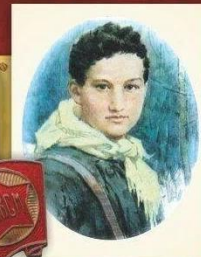
КОСМОДЕМЬЯНСКАЯ Зоя Анатольевна (1923-1941)

Командир орудия, гвардии старший сержант. В сентябре 1943 г. при форсировании Днепра переправившись на захваченный врагом плацдарм, со своим расчетом вступил в бой подкрепив его наступление советской пехоты и уничтожая орудия и боеприпасы противника.