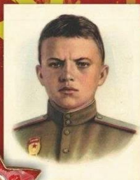
МАТРОСОВ Александр Матвеевич (1924-1943)

Военный лётчик, капитан, командир эскадрильи. Погиб 26 июня 1941 года совершая огненный таран: направил горящую машину на механизированную колонну врага.